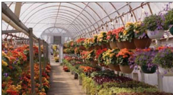
Stænkæt model 140 (IPx5) er beregnet til lokaler med høj luftfugtighed såsom gartnerier, svømmehaller, fødevarerproduktion og andre "vådrum"