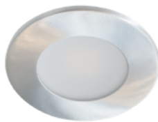
Alina 2,2W + LED driver 1885 . . . 15