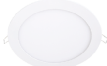
Lucette Slim LED Downlight 12W . . . . . 19