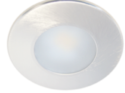
Gabriella 4W + LED driver 1885 . . . 13