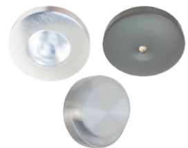
Viola, Elena, Anthea 2W + LED driver 1885 . . . 17