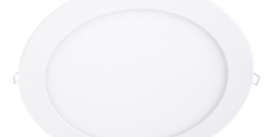
Lucette Slim LED Downlight 24W . . . . . 21