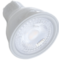
Lyskilde GU10 5,5W . . . . . 4