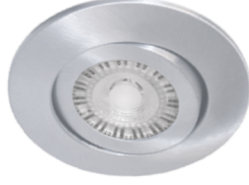
Low Profile Dim to Warm . . . . . 11