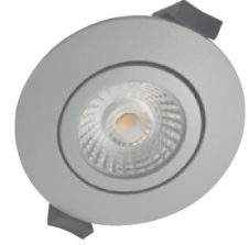
Low Profile ECO . . . . 9