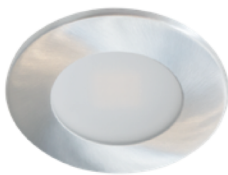
Alina 2,2W + LED driver 1872 . . . 14