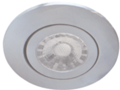
Low Profile Flexible . . . . . 10