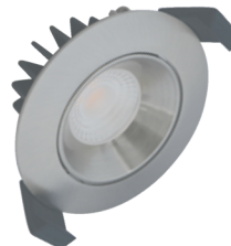
Velia Low Profile . . . . 8