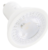
Lyskilde GU10 Long life 5W . . . . . 5