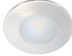
Gabriella 4W + LED driver 1872 . . . 12