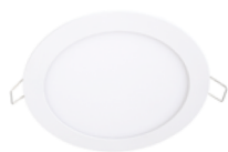
Lucette Slim LED Downlight 6W . . . . . 18