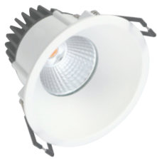
Velia 10,9W serie . . . . 6