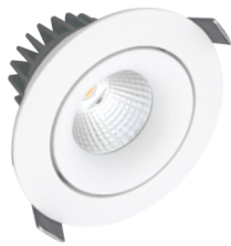
Velia 12,7W DtW . . . . 7